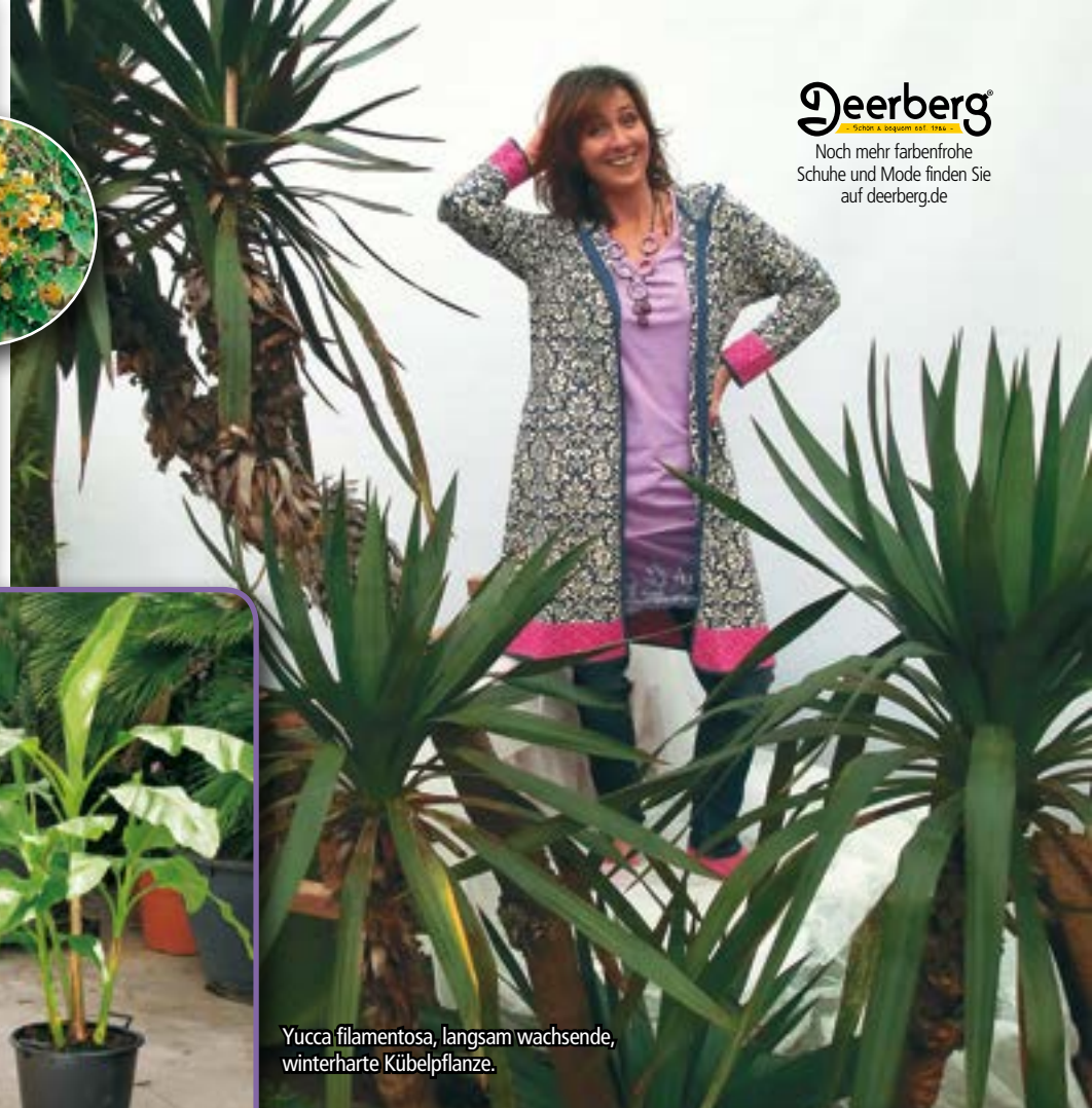
Yucca filamentosa, langsam wachsende, winterharte Kübelpflanze.